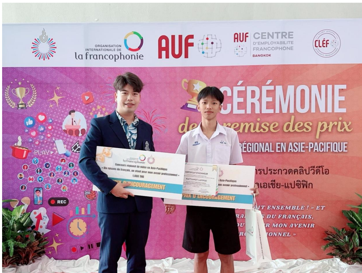
รางวัลการประกวดคลิปวิดีโอ ระดับภูมิภาคเอเชียแปซิฟิก

จากศูนย์ความร่วมมือนานาชาติ ของกลุ่มประเทศผู้ใช้ภาษาฝรั่งเศส