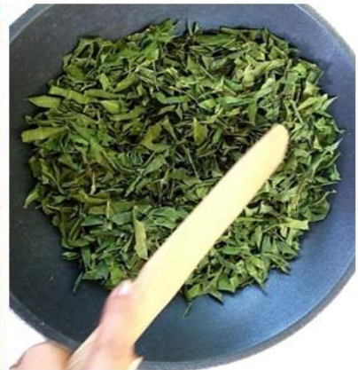
มาคั่วและบดให้ละเอียด