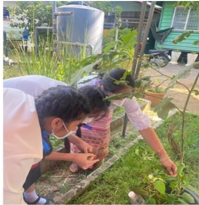
ตัดใบจากยอดลงมา (ไม่แก่และไม่อ่อน)