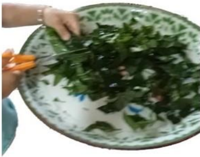
ตัดให้เป็นชิ้นเล็กๆ