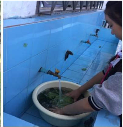
นำมาล้างให้สะอาด