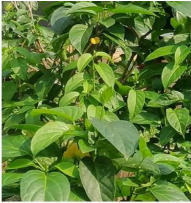
ผักเชียงดา (แปลงผักในโรงเรียน)