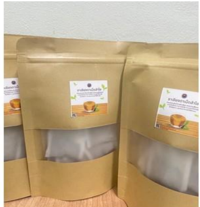
ซองผักเชียงดาเม็ดลำไย

ผู้เรียนได้เรียนรู้การปลูกผักเชียงดา สรรพคุณของผักเชียงดาและเม็ดลำไย ในด้านคุณประโยชน์ต่อสุขภาพ ผู้เรียนจึงเกิดแนวคิดในการนำผักเชียงดามาทำเป็นชา ร่วมกับเม็ดลำไย เป็นผลิตภัณฑ์ “ชาผักเชียงดาเม็ดลำไย” โดยผ่านขั้นตอนการเก็บยอดเชียงดามาผึ่งแดดจนแห้งกรอบแล้วนำมาบดจนละเอียด ผสมกับผงเม็ดลำไยบด บรรจุถุงเพื่อใช้ชงดื่ม ช่วยในการควบคุมระดับน้ำตาลในเลือดได้ จนนักเรียนเกิดทักษะในการสร้างผลิตภัณฑ์ สู่การทำเป็นอาชีพได้