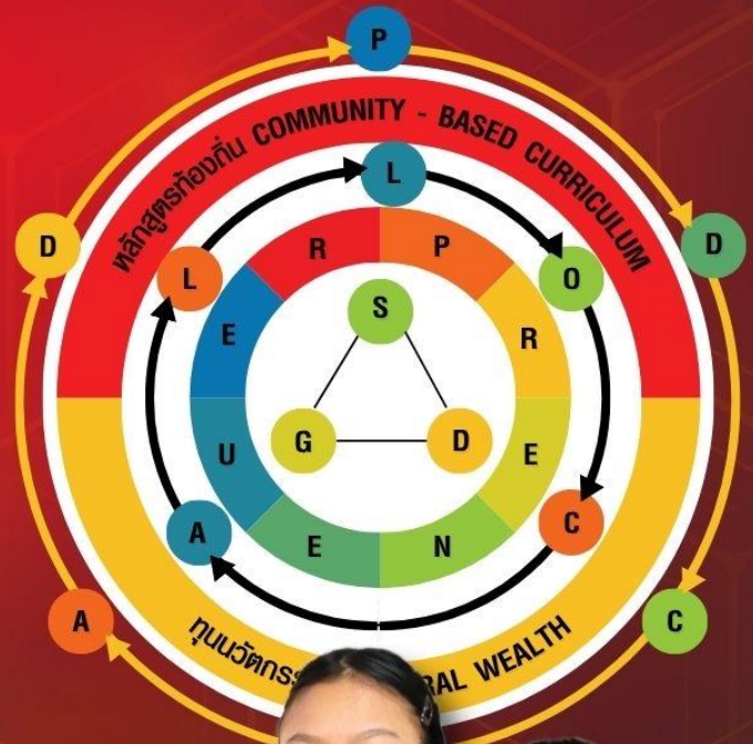
นายทศรชา ปัญญารัตน์ รองผู้อำนวยการสถานศึกษา