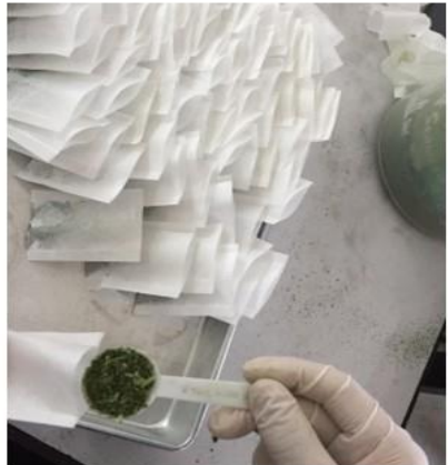
บรรจุถุง