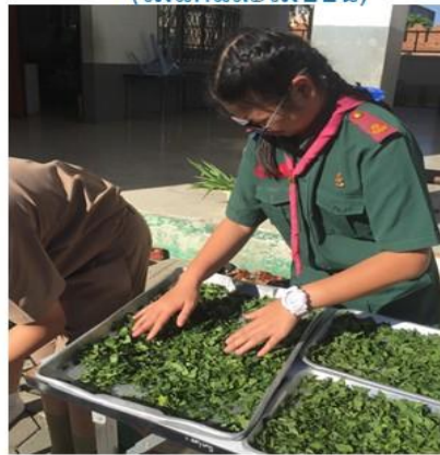
หั่นและผึ่งแดดให้แห้ง