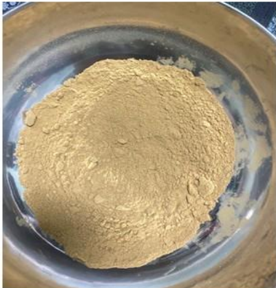
นำเม็ดลำไยบดมาผสมให้เข้ากัน